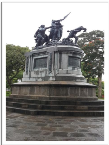
Monumento Conmemorativo de la Guerra Nacional Fotografía: Marco Tulio Mena, octubre 2014

Aquí no encontrarán jamás los invasores, partido, espías ni traidores. ¡Hay del nacional ó extranjero que intentare seducir la inocencia, fomentar discordias o vendernos! Aquí no encontrarán más que hermanos, verdaderos hermanos resueltos irrevocablemente a defender la patria como á la santa madre de todo cuanto aman y á exterminar hasta el último de sus enemigos". (Moras Porras, Juan Rafael, 1855)